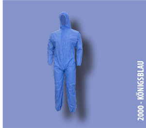
2000 - KÖNIGSBLAU